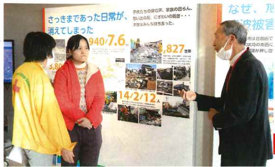
旭市防災資料館で、東日本大震災についての説明に、真剣に耳を傾けていました