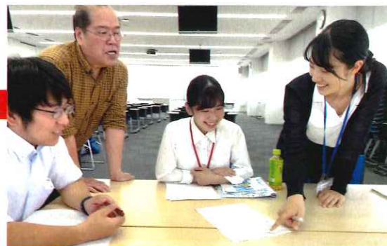
青少年赤十字に関わる先生方に研修を行いました