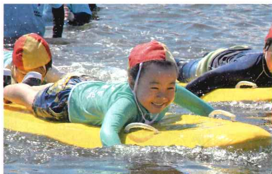
子どもたちに水の事故からいのちを守る方法を伝えました