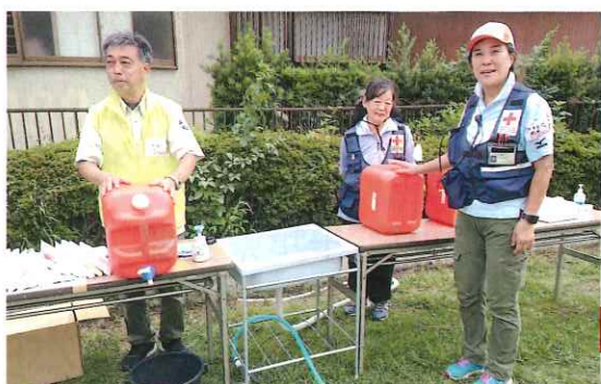
茂原市災害ボランティアセンターで運営を手伝いました