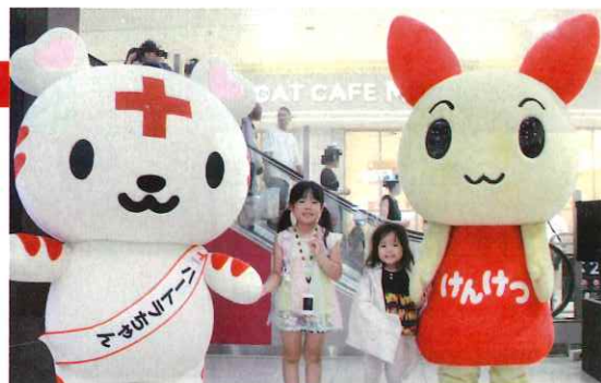
子どもたちに赤十字のことを知ってもらいました