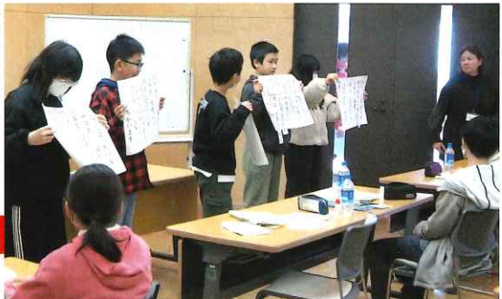
青少年赤十字のメンバーが2泊3日の研修を行いました

救急法指導員養成研修 救急法イベント 救護班要員(主事)研修会 レッドクロス・ボランティアスクール 青少年赤十字スタディーセンター