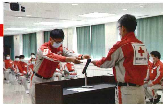
医療救護班の任命をしました

青少年赤十字指導者協議会役員会・総会 防災ボランティア推進協議会 地区・分区新任事務委員研修会