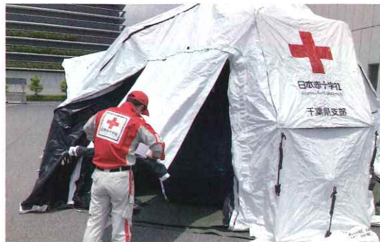
災害時に、救護所等に使用されるテントの設営訓練を行いました