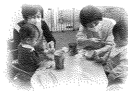
▲場所 沼南社会福祉センター